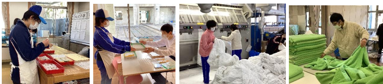
（高等部の工場で働く様子）

一部の3年生は高等部の就業体験に参加し、先輩からやり方を教えてもらい一緒に仕事をしました。近隣の就労継続支援事業所「ブルーオーシャン」に行って、洗濯済みのシーツを乾燥する機械に入れたり、乾いた肌掛けをたたんだりする仕事も体験してきました。長時間の立ち仕事や、普段関わらない方々とのやりとりに、今までとは違う大変さを感じながらも、やり遂げることができたことへの満足感や自信を持ってました。